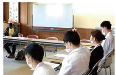
支部会議にも参加しました